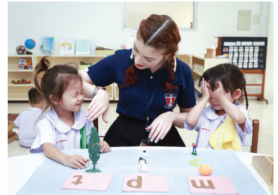
MONTESSORI BASED ON THE BIBLE